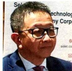
Jointly coordinated by Invest Selangor and Selangor Information Technology and Digital Economy Corporation (Sidec), in collaboration with e-commerce platforms Shopee and Lazada, the campaigns are part of