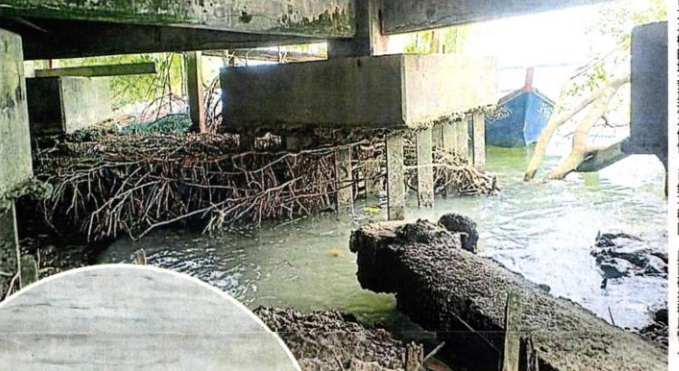
大水槽的地基遭海水侵蚀，已经不稳，底部破损程度惊人。