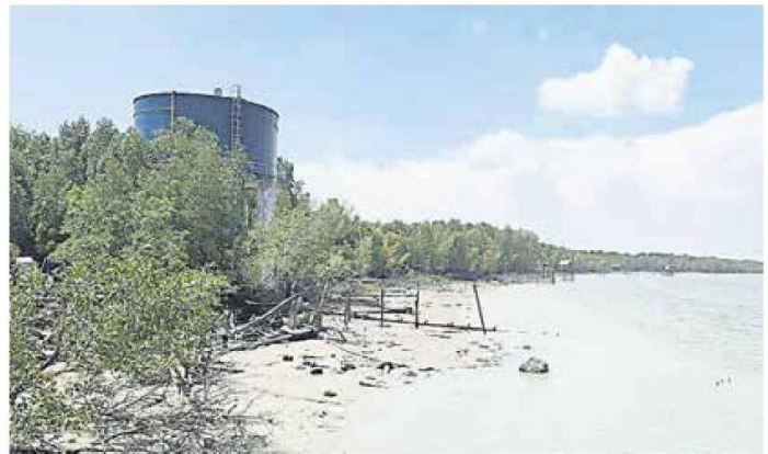
■吉胆岛居协盼雪州水务管理公司，若能修复及启用回大水槽，才能克服水压偏低问题。

(巴生14日讯) 尽管吉胆岛居协和船家之前曾担忧退潮浮出海面的海底水管会可能被撞破，结果海底水管果然于上周被船只撞破，导致吉胆岛和五条港陷入大断水。不过，雪州水务管理公司已于昨日(13日)成功抢修，水供目前在逐步恢复输送。