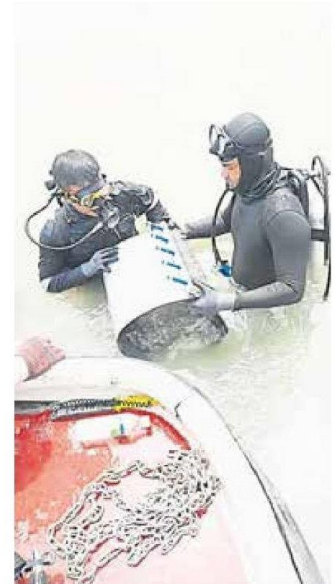
■经过雪州水务管理公司派员抢修后，爆裂的水管已于昨日(13日)成功修复，水供目前逐步恢复当中。