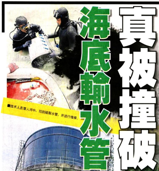
技术人员潜入河中，找到破裂水管，并进行维修。